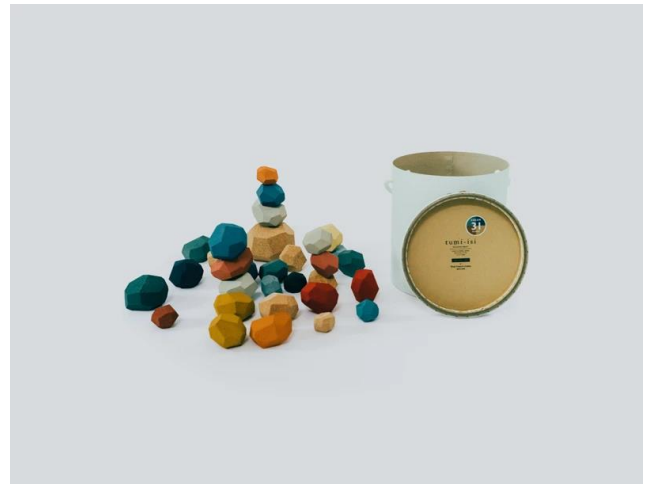
TOKYO CORK PROJECT tumi-isi

https://zaima.in/products/anela-stopper-stool