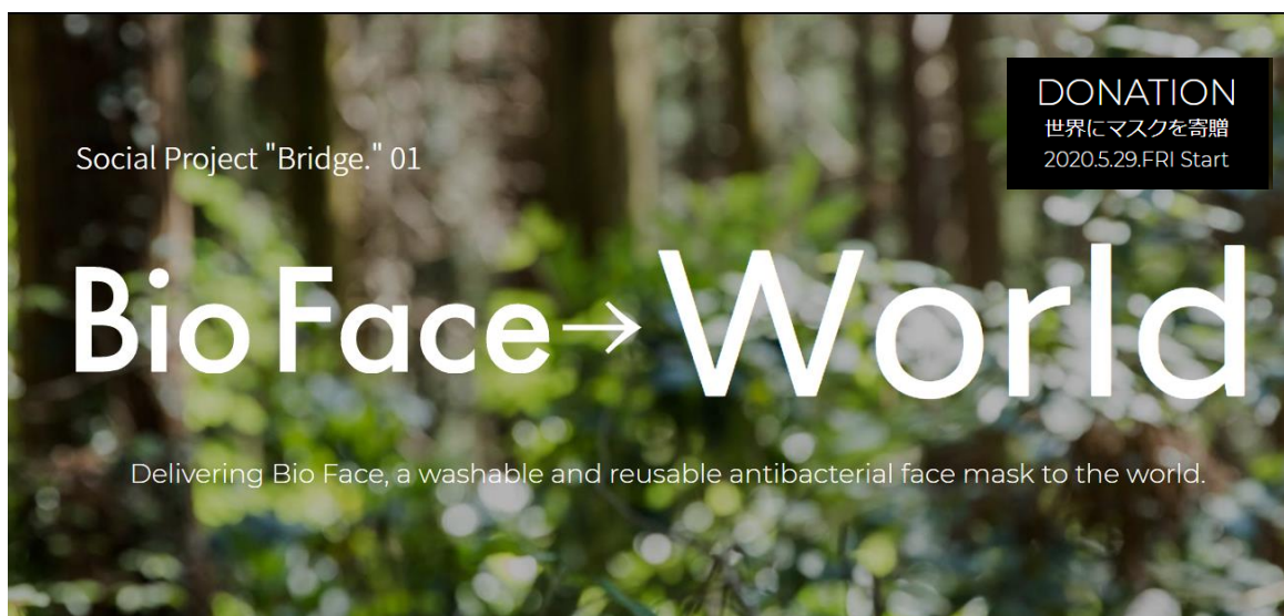
「Bridge.」特設サイト TOP イメージ

今後、TBM は企業理念の実現を目指し、社名の由来（Times Bridge Management）でもある、次の時代に橋を架ける使命を果たしていくために、ソーシャル・プロジェクト、「Bridge.」を通して、持続可能な社会づくりに貢献してまいります。