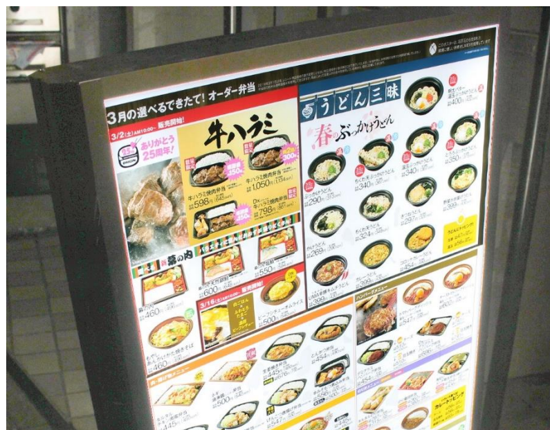
<導入事例：オリジン弁当 屋外電飾ポスター>