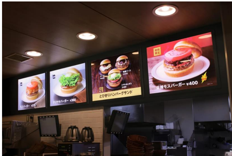
<導入事例：モスバーガー 店内内照メニュー>

| 詳細ページ | https://tb-m.com/limex/products/limexelsheet/