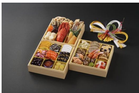
LIMEX 製トレーを使用したおせち 『慶春譜(けいしゅんふ)』

「イシイのおせち料理 2020」の商品に、食品業界のおせち分野として初めて、環境に配慮したトレーの一部に LIMEX 製のトレーを採用しました。商品としては、既に受注を開始している『慶春譜(けいしゅんふ)』(和洋中 3 段重)は全てのトレーを LIMEX 製に切り替えており、その他『祝春華(いわいしゅんか)』(和風 3 段重)『豊春(ほうしゅん)』(和風 2 段重)『冷凍おせち舞』(和洋中 3 段重)も一部のトレーの切り替えを行っております。従来のプラスチック製トレーから LIMEX 製に切り替えることで、約 345kg の石油由来プラスチックの削減を目指します。※TBM 算出