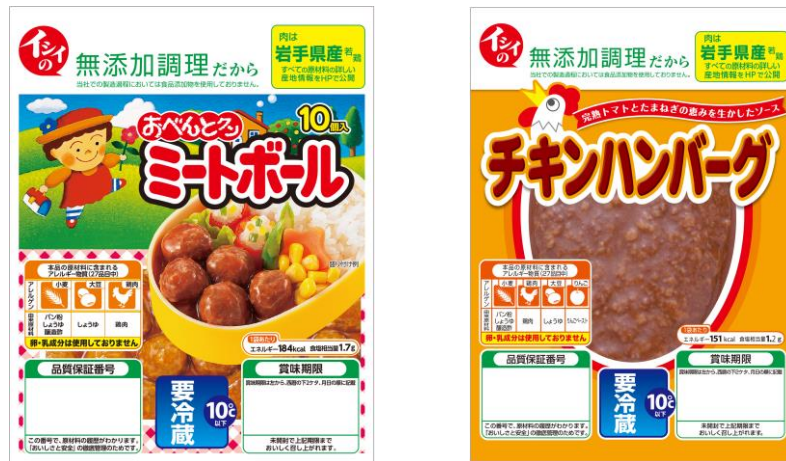
(LIMEX 製への切り替えを目指す対象商品一部)

EU がストローやコップなど 10 品目の使い捨てプラスチック製品の使用が禁止する 2021 年を目指して、LIMEX 製パッケージ（軟包材）を開発し、石井食品の主力製品である「おべんとクン ミートボール」をはじめとしたおべんとクンシリーズや「チキンハンバーグ」などのパッケージを LIMEX 製へ切り替えることを目指します。現在主力 2 商品群の売上高は 81 億 7,900 万円であり、約 232 トンの石油由来プラスチックを使用しており、LIMEX 製に切り替えることで、石油由来プラスチックの使用量が大きく削減されます。※石井食品算出