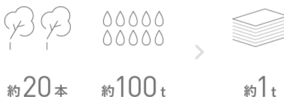
普通紙 LIMEX から作る紙